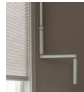
7 Accionamiento mediante manivela o varilla