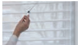
2 SmartCord® y UltraLift™