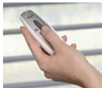
3 PowerRise® y el funcionamiento motorizado